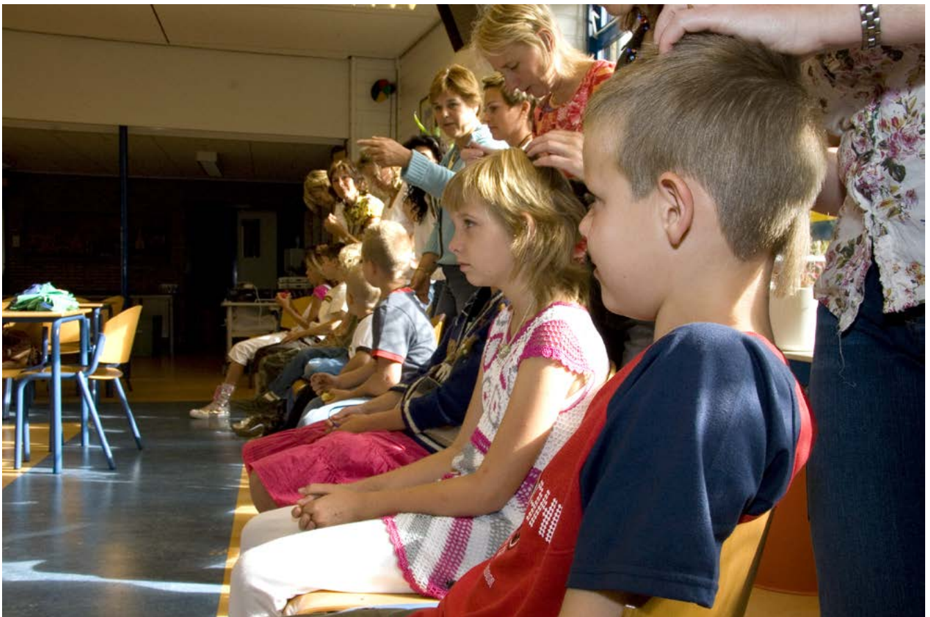
Een ouderwerkgroep kan op school de kinderen regelmatig controleren.